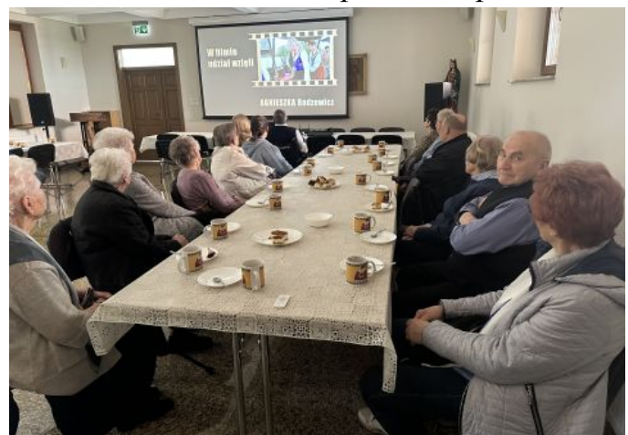
18 kwietnia 2026 Parafialny Dzień Seniora i Chorego